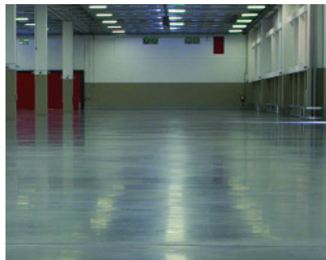
Exemplu de pardoseala industriala cu adaos de Mapefibre NS12